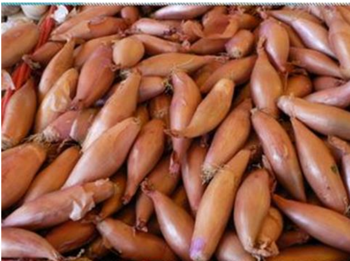
Лук – шалот