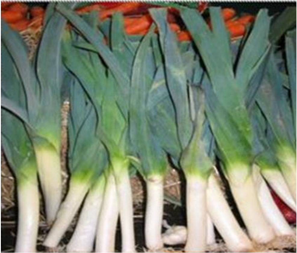
Лук – порей