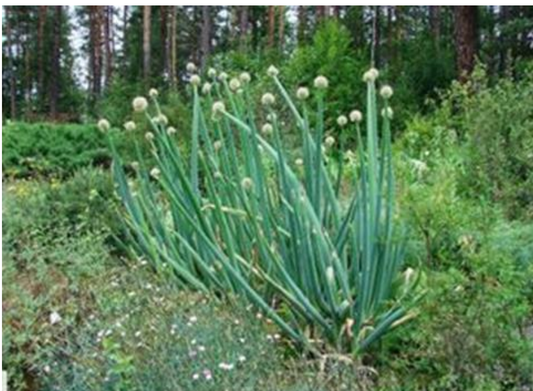
Лук алтайский (горный)