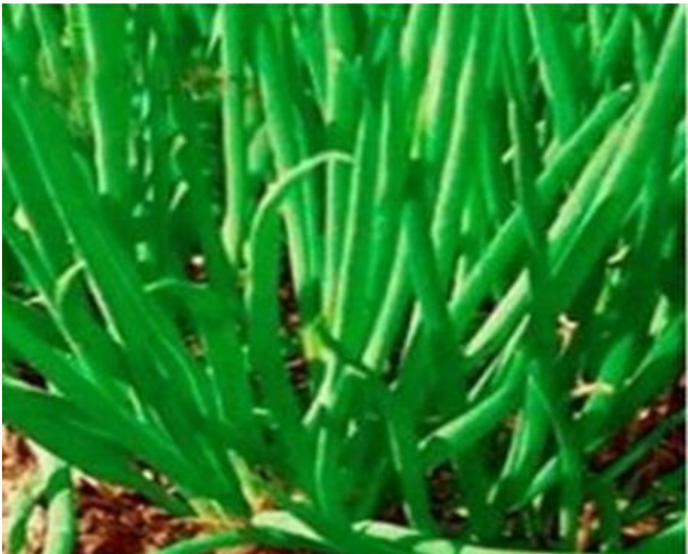
Лук – батун