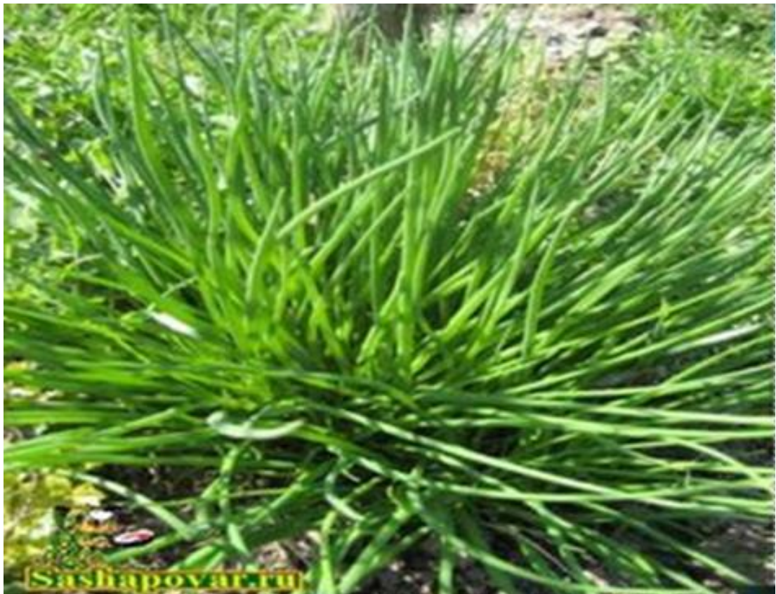
Лук – резанец (шнитт-лук)